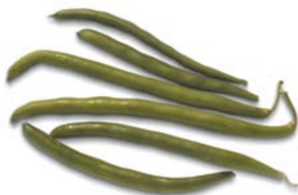
đậu quả xanh green beans