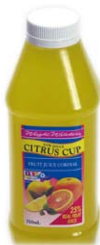
nước ngọt cho người ăn kiêng diet cordial