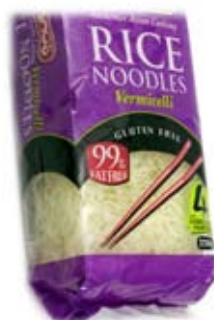
bánh phở 1/3 ly đã nấu