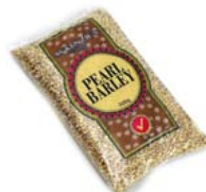
lúa mạch 1/2 ly đã nấu barley 1/2 cup cooked