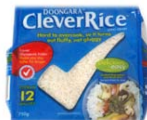
gạo don ga ra 1/3 ly đã nấu doongara rice 1/3 cup cooked