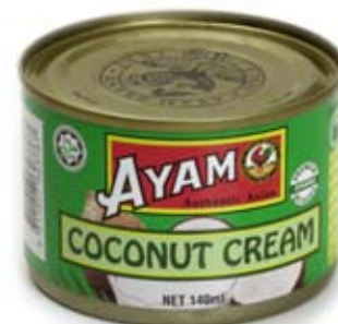
nước cốt dừa coconut cream