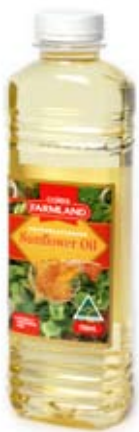
dầu hoa hướng dương sunflower oil