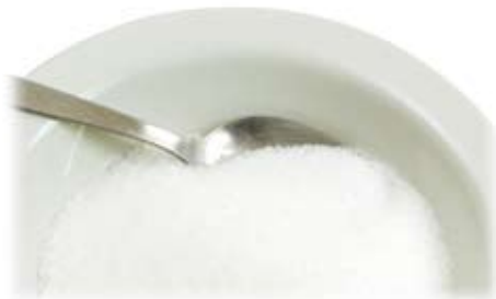
đường trắng white sugar