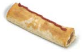
bánh nhân cuốn sausage roll