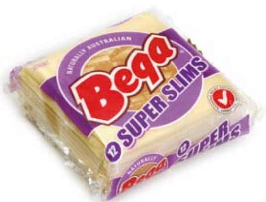
phó mát lát ít béo low fat sliced cheese