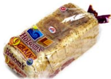
bánh mì nguyên hạt 1 lát

Carbohydrate foods are good for you. These foods will put some sugar in your blood, which your body uses for energy. Try to spread carbohydrate foods over three meals a day. Too much carbohydrate food eaten at a meal or snack will put too much sugar in your blood. Some people with diabetes may also need to eat between meals and before bed. The amount equal to one serve of carbohydrate is written under the foods. A dietitian can tell you how many serves of carbohydrate to eat at each meal and whether you also need to eat snacks.