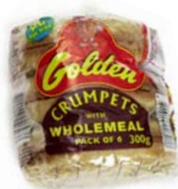
bánh xốp 1 lát