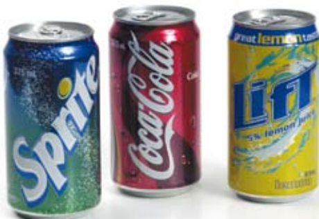
nước ngọt có ga soft drink