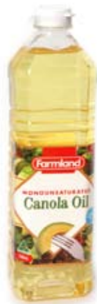
dầu canôla canola oil