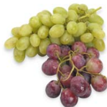
nho grapes 1 ly 1 cup