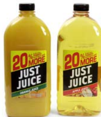
nước trái cây 1/2 ly fruit juice 1/2 cup