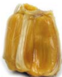
mít 1/2 ly đã cắt jack fruit 1/2 cup sliced