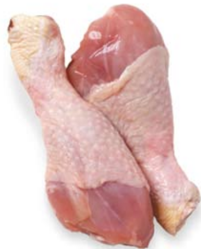
thịt gà có da chicken with skin