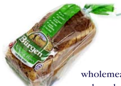
wholemeal bread 1 slice