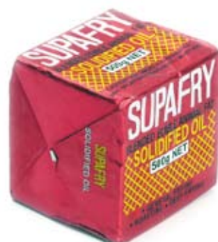
dầu nấu ăn đặc solid cooking oils