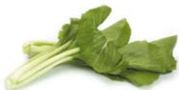
cải tào bok choy