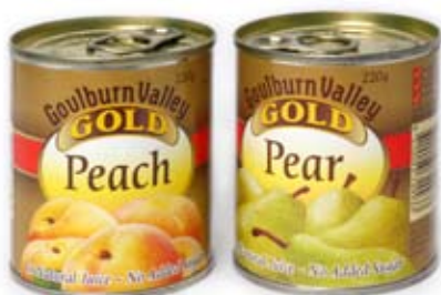
trái cây hộp 1/2 ly tinned fruit 1/2 cup