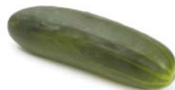
đưa chuột cucumber