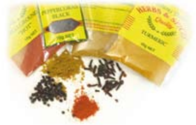
gia vị spices

Chỉ dùng lượng nhỏ Use only in small amounts