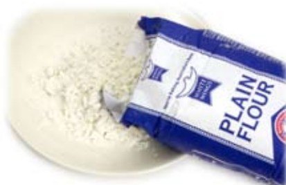
bột trơn 2 thìa lớn flour plain 2 tablespoons