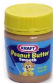
bơ lạc peanut butter