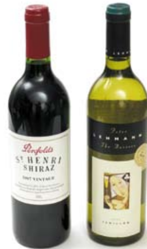
rượu vang ly 100mL

285mL (regular beer) 425mL (low alcohol beer)