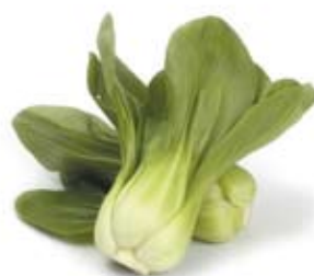
cải tào nhỏ baby bok choy