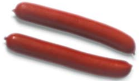
xúc xích Đức frankfurts