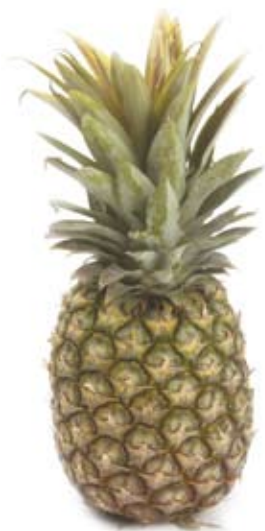
dứa 2 lát pineapple 2 slices