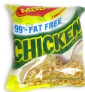
mì sợi nấu 2 phút 1/2 gói (ít chất béo) 2 minute noodles (low fat) 1/2 packet