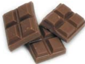
sô cô la chocolate