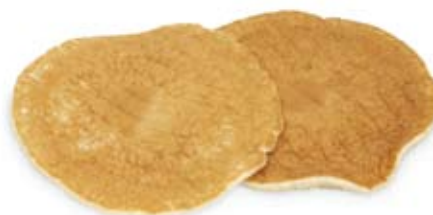
bánh kếp 1 bánh nhỏ pancakes 1 small