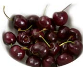
trái xê ri cherries 1 ly 1 cup