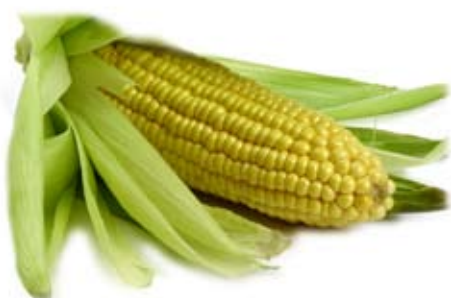
bắp ngô 1 bắp nhỏ