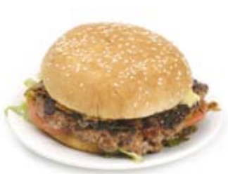
bánh mì hambua Hamburger

These foods are high in fat or sugar or both. Try to avoid these foods or limit them to special occasions.