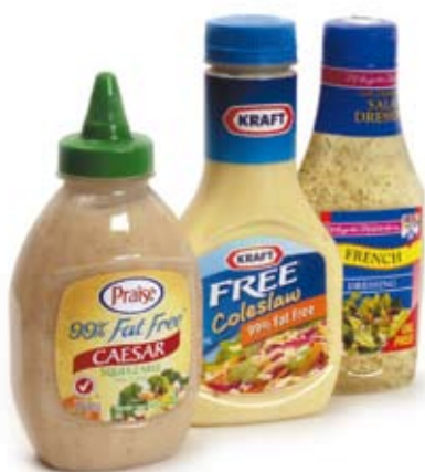
dầu trộn rau ít chất béo low fat salad dressings