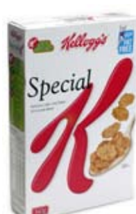
breakfast cereals 1/4-3/4 cup