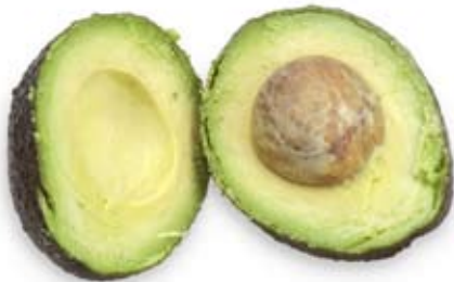
trái bơ avocado

These fats are good for your heart, eat in small amounts.