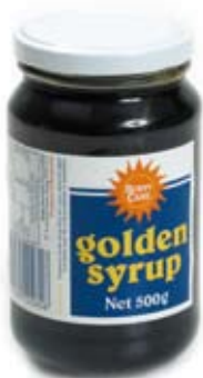
xi rô vàng Golden Syrup

Limit foods that contain mainly sugar. These foods put sugar in your blood but do not contain anything else that is good for you. Sugar, jam and honey can be eaten in small amounts.