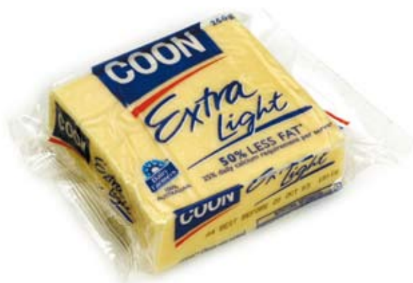
phó mát giảm chất béo reduced fat cheese