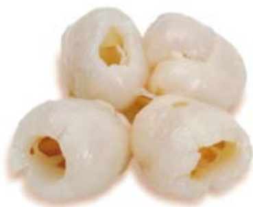
vải 10 trái lychees 10 whole