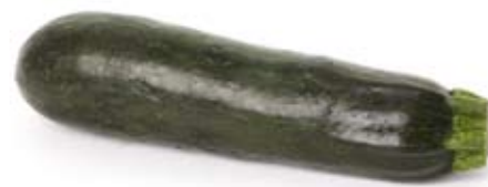
mướp tây zucchini