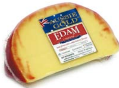
phó mát nguyên chất béo full fat cheese