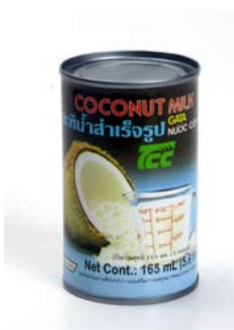
nước dừa coconut milk