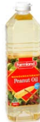
dầu lạc peanut oil