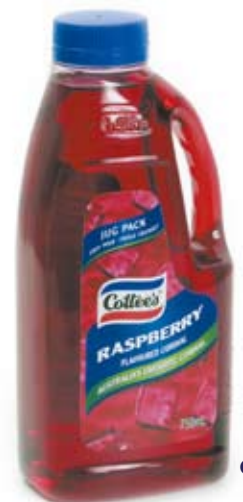
cordial nước ngọt pha màu