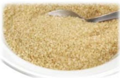
đường nâu brown sugar