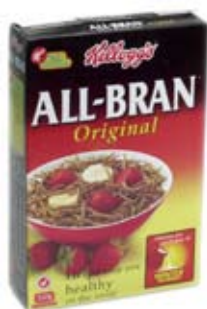
ngũ cốc ăn sáng 1/4-3/4 ly