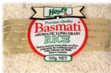
gạo bát ma ti 1/3 ly đã nấu basmati rice 1/3 cup cooked