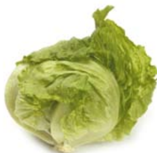
rau diếp lettuce