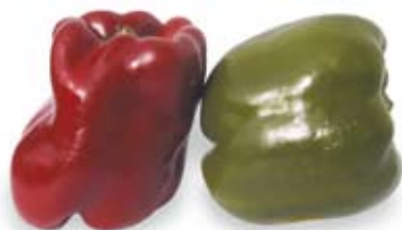
ớt quả lớn capsicum