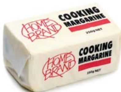
bơ thực vật để nấu ăn cooking margarine