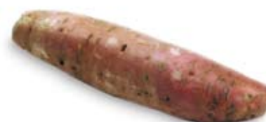
khoai lang 1 củ nhỏ