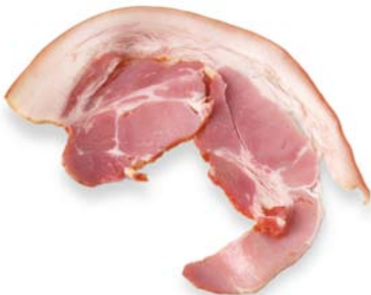
thịt lợn muối có mỡ fatty bacon