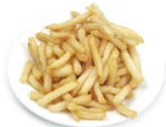
khoai tây rán hot chips