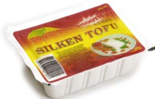
đậu phụ tofu