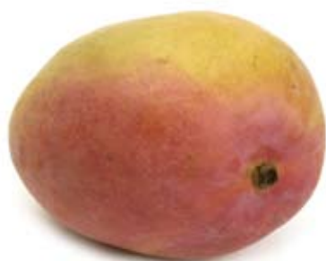
xoài mango 1 trái nhỏ 1 medium