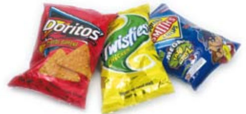
khoai lát giòn crisps