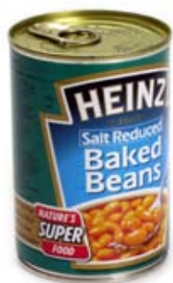
đậu hạt nấu baked beans 1/2 ly 1/2 cup