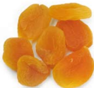
mơ khô 5 trái nguyên dried apricots 5 whole