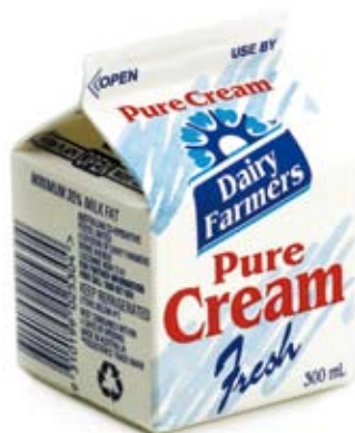
kem sữa cream