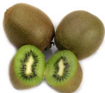
kiwi kiwi fruit 2 trái nhỏ 2 medium