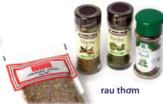
rau thơm herbs