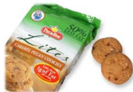
bích quy giảm chất béo reduced fat biscuits

(2-3 bích quy ngọt) (2-3 sweet biscuits)