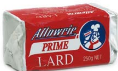
mỡ lợn lard