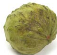
na custard apple 1/4 trái đã gọt vỏ 1/4 peeled