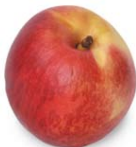
xuân đào nectarine 2 trái nhỏ 2 medium