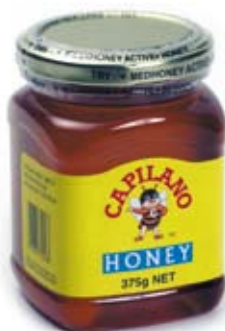
mật ong honey