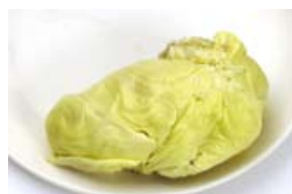
sầu riêng 1/4 ly durian 1/4 cup