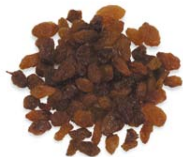
nhô khô 1 ½ thìa lớn sultanas 1 ½ tablespoons