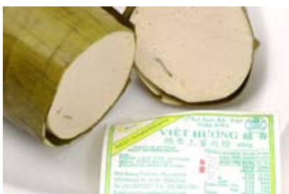
giò lụa pork roll