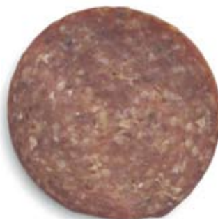
xúc xích Ý salami