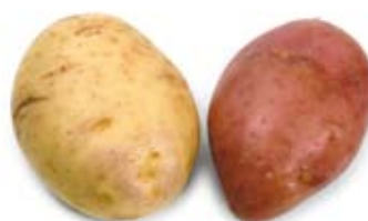
khoai tây 1 củ nhỏ potatoes 1 medium