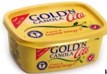
bơ thực vật margarine