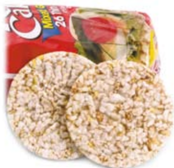
bánh làm bằng gạo 2-3 bánh rice cakes 2-3 rice cakes

(2-4) bánh dòn hoặc bánh mì dòn (2-4) crackers or crispbreads