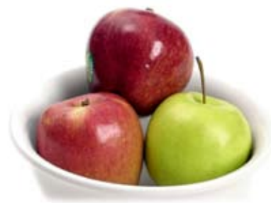
táo apple 1 trái nhỏ 1 medium