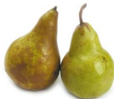
lê 1 trái nhỏ pear 1 medium