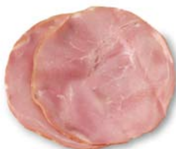
giăm bông nạc lean ham