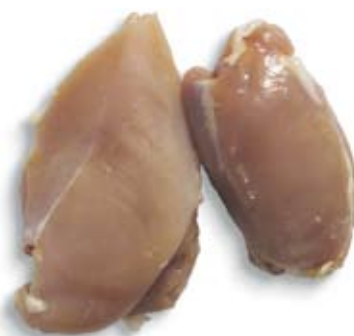
thịt gà không da skinless chicken