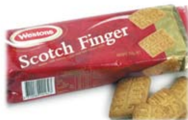
bích quy bơ short bread