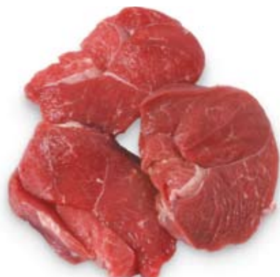
thịt bò nạc lean beef