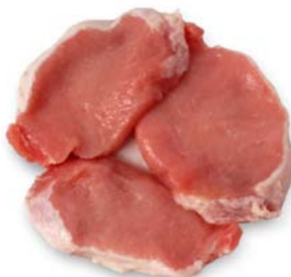
thịt lợn nạc lean pork