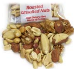
đậu hạt (không muối) nuts (unsalted)