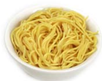
mì sợi 1/3 ly đã nấu