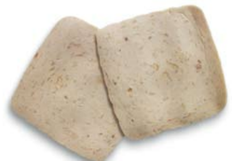
thịt gà cuốn thành thỏi lớn chicken loaf