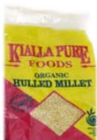
kê 1/2 ly đã nấu millet 1/2 cup cooked