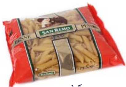
mì ống 1/2 ly đã nấu pasta 1/2 cup cooked