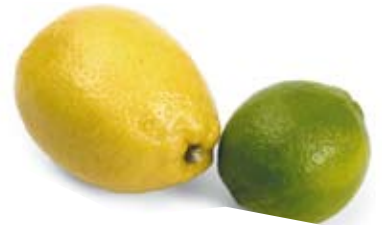
chanh và chanh giấ lemon and lime