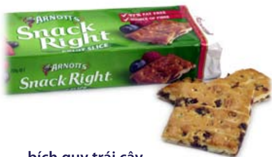
bích quy trái cây fruit biscuits