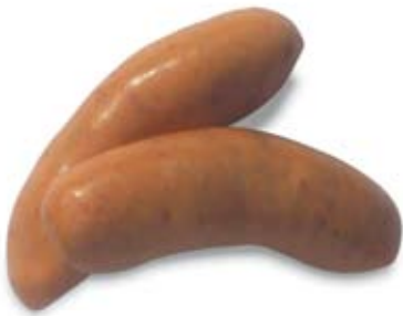
xúc xích sausages