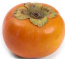
hồng 1/2 trái nhỏ persimmon 1/2 medium