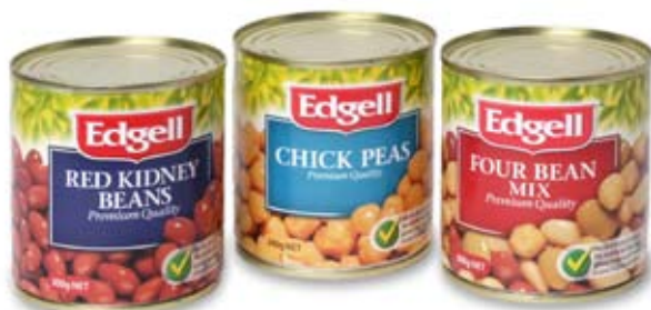
rau đậu legumes 1/2 -1 ly 1/2 -1 cup