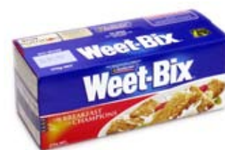
2 bánh bích quy 2 biscuits