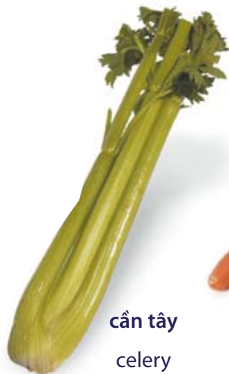
cần tây celery