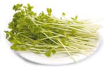
giá đậu Hà lan snow pea sprouts