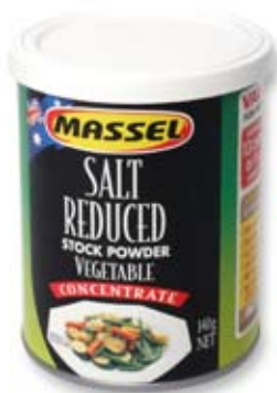
bột nêm loại ít muối salt reduced stock powder

Chỉ dùng lượng nhỏ Use only in small amounts