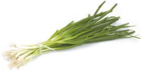
hành ta shallots

Ăn nhiều những thực phẩm này Eat plenty of these foods