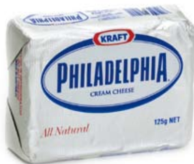
phó mát kem cream cheese