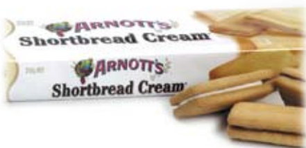
bích quy kem cream biscuits