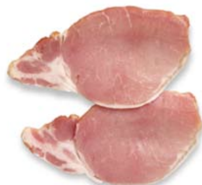
thịt lợn muối nạc lean bacon