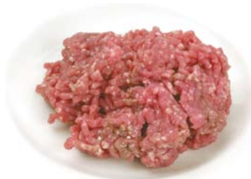
thịt xay nạc lean mince meat