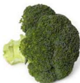
xúp lơ xanh broccoli