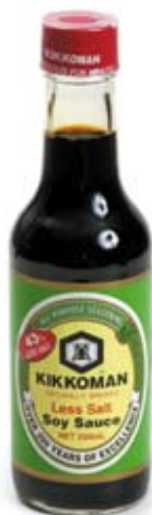
nước tương (giảm muối) soy-sauce (salt reduced)