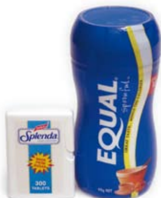
đường hóa học artificial sweeteners