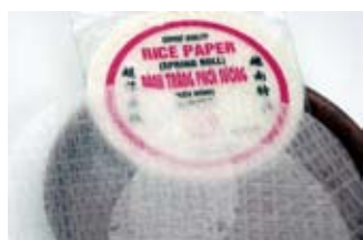
bánh tráng 10 tờ