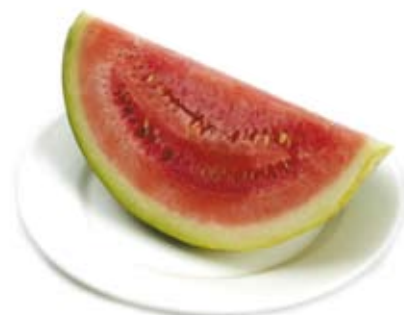
dưa hấu 2 ly watermelon 2 cups