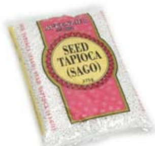
bột năng 1/2 ly đã nấu tapioca 1/2 cup cooked