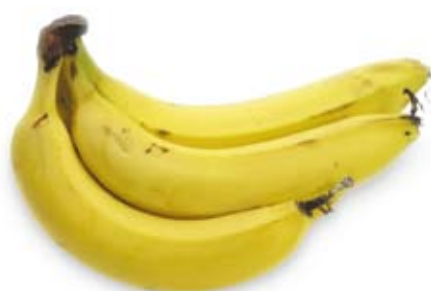
chuối banana 1 trái nhỏ 1 medium