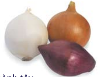
hành tây onion