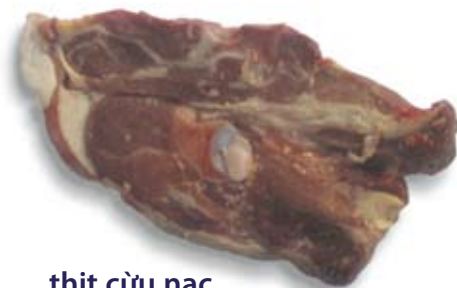
thịt cừu nạc lean lamb