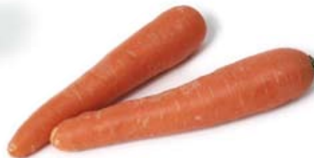
cà rốt carrot