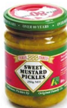
đồ chua pickles