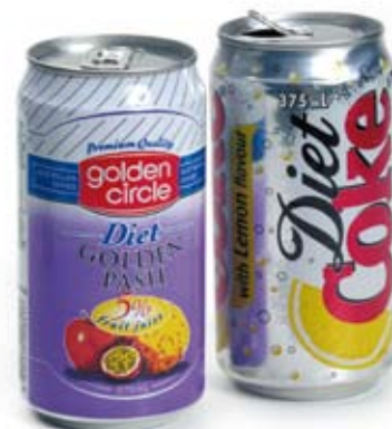
nước ngọt có ga cho người ăn kiêng diet soft drink