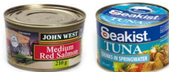
cá hộp canned fish