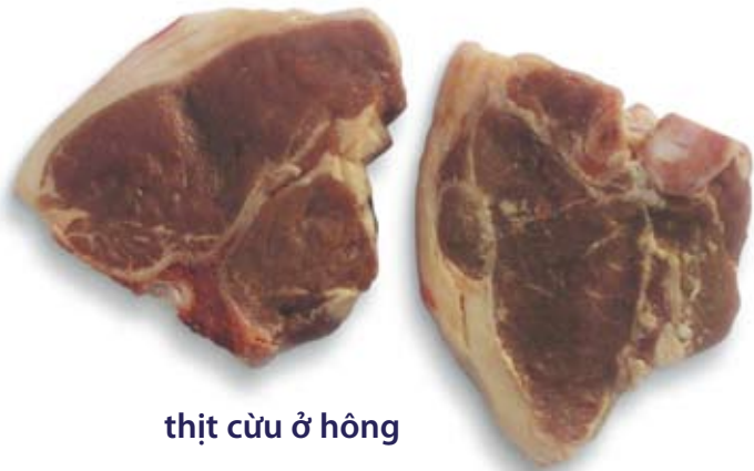
thịt cừ ở hông lamb loin

High fat protein foods - try to limit these foods