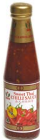
xốt ớt ngọt sweet chilli sauce