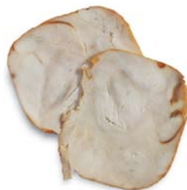
ngực gà tây nạc lean turkey breast