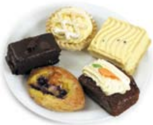
bánh ngọt và bánh xếp nướng cakes and pastries