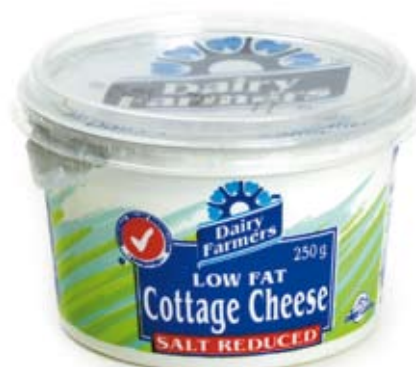
phó mát không kem cottage cheese