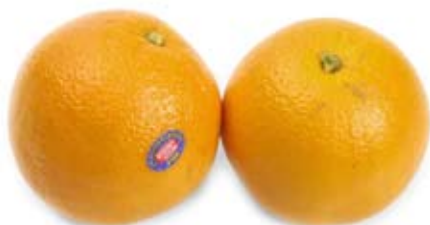
cam 1 trái lớn orange 1 large