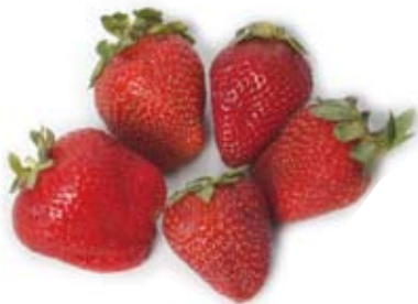
dâu tây strawberries