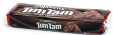
bích quy sô cô la chocolate biscuits