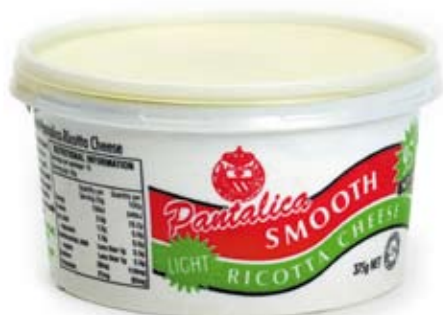
phó mát trắng mềm ricotta cheese