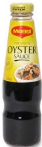
dầu hào oyster sauce