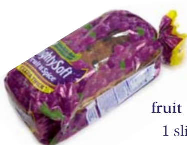
fruit loaf 1 slice