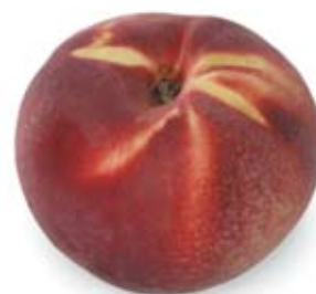
đào peach 2 trái nhỏ 2 medium