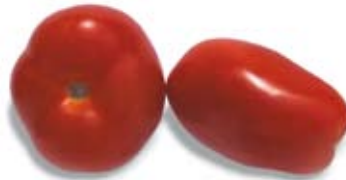
cà chua tomatoes