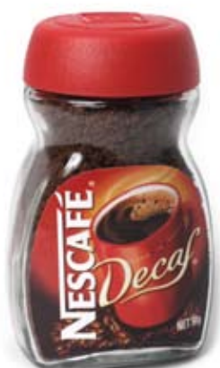
cà phê coffee