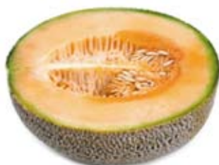
dưa đá 1/2 trái nguyên rock melon 1/2 whole