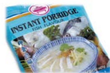
cháo gạo 1 ly đã nấu