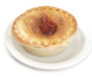
bánh nhân thịt meat pie