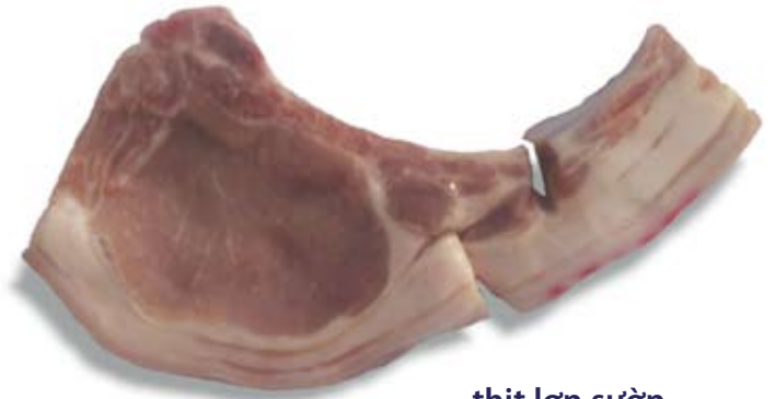
thịt lợn sườn pork chop